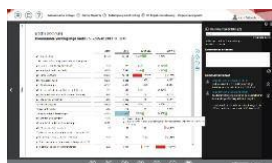
Bericht mit aktivierter Kommentarübersicht