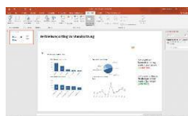
In PowerPoint eingebettetes Dashboard kombiniert mit weiteren ppt-Objekten

[ Download unter https://ars-pr.de/presse/20180522_idl ]