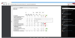
Bericht mit aktivierter Kommentarübersicht

[ Download unter http://ars-pr.de/presse/20180322_idl ]