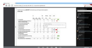
Bericht mit aktivierter Kommentarübersicht

[ Download unter http://ars-pr.de/presse/20180405_idl ]