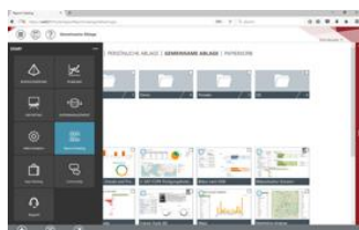
IDL CPM Suite – individualisierbares App- Startmenü