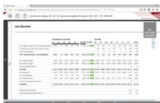
IDL Reporting Plattform – Berichtsdynamisierung