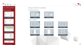
IDL.DESIGNER Neuen Bericht erstellen