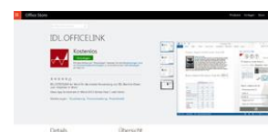
IDL.OFFICELINK for Word im Office-Store

[ Download unter http://www.ars-pr.de/de/presse/meldungen/20150716_idl.php ]