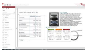
Berichts-Design im IDL.DESIGNER. Die erstellten Berichte werden im Report-Katalog der IDL Reporting Plattform publiziert und stehen den Word-Anwendern über die IDL.OFFICELINK App zur Weiterverarbeitung zur Verfügung.