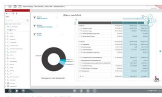
Berichterstellung per Drag&Drop mit dem IDL.DESIGNER