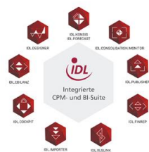
Integrierte CPM- und BI-Suite für Finanzwesen und Controlling