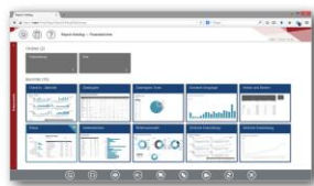
IDL-Reporting-Plattform mit IDL.DESIGNER und Report-Katalog