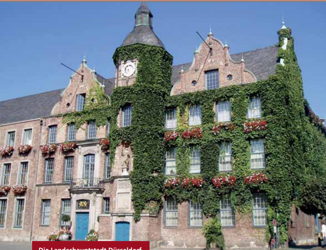
Die Landeshauptstadt Düsseldorf bewältigt ihren Gesamtabschluss bereits mithilfe von IDL-Software

Der Gesamtabschluss ist deutlich mehr als die bloße Addition der Einzelabschlüsse der einzelnen Organisationseinheiten und der Anwender hat umfangreiche Entscheidungen hinsichtlich der Konsolidierung zu treffen. Vor diesem Hintergrund benötigt er automatische Unterstützung bei sämtlichen relevanten Maßnahmen, wie etwa der Kapital-, Schulden- oder auch der Aufwands- und Ertragskonsolidierung. Die maschinelle Abstimmung der Salden (Forderungen/Verbindlichkeiten, Aufwendungen/Erträge) zwischen verbundenen Organisationseinheiten sollte ebenso integraler Bestandteil einer Softwarelösung sein. Zudem dürfen auch die notwendigen Aktivitäten im Zusammenhang mit der Fortführung des Rechenwerkes im Rahmen der Folgekonsolidierung nicht unterschätzt werden. Hier muss eine Software unkompliziert automatische Fortschreibungen unterstützen. Dies alles sind Funktionalitäten und Mechanismen, die in einer Excel-Umgebung erst mühsam selbst aufgebaut und ständig gewartet werden müssen. Darüber hinaus sollte unbedingt bedacht werden, dass mangels konsistenter Datenhaltung und fehlender betriebswirtschaftlicher Logik die Nutzung von Excel mit zahlreichen potenziellen Fehlerquellen verbunden ist. Auch